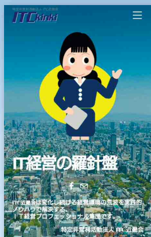
ITC 近畿会ホームページ

ITC 近畿会では、みなさんへの情報発信の一層の強化を目的として、ホームページをリニューアルしました。パソコンはもちろん、スマートフォンでもご覧いただけます。中小企業経営者、幹部、社員のみならず、お役に立つ情報が満載です。また、Facebook ページでも、おすすめ情報を掲載しています。ITC 近畿会の Facebook ページで「いいね!」をしていただくと、あなたのタイムラインに最新情報が届きます。